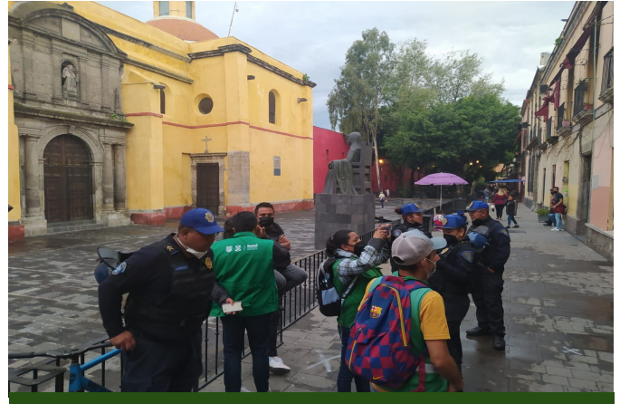
Supervisión San Jerónimo