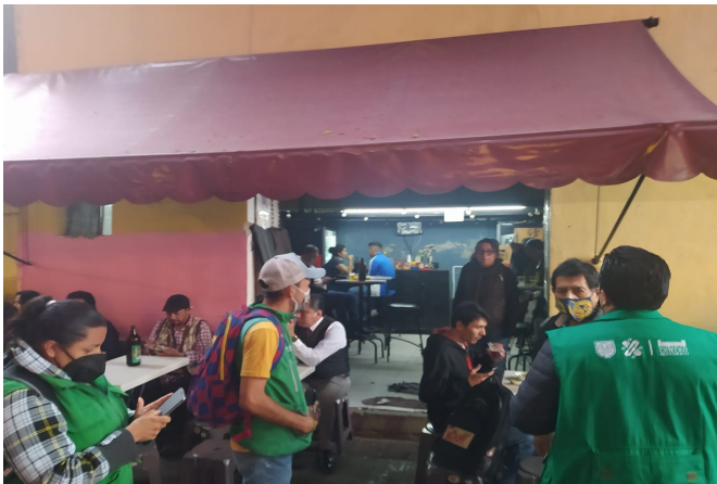
Supervisión San Jerónimo