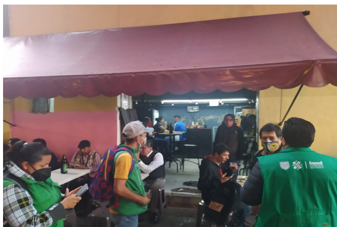
Supervisión San Jerónimo