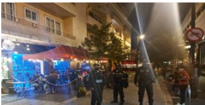
Recorridos de Seguridad Regina