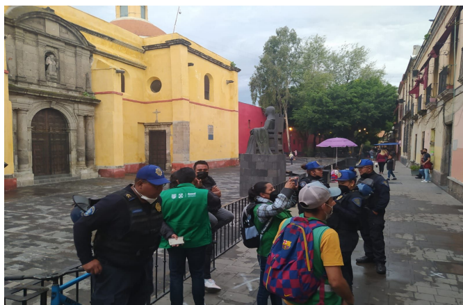
Supervisión San Jerónimo