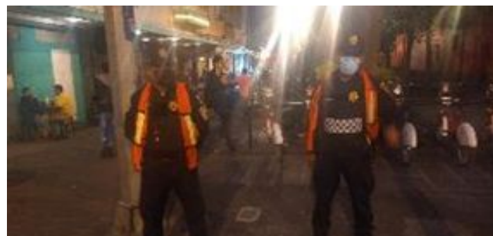
Recorridos de Seguridad San Jerónimo