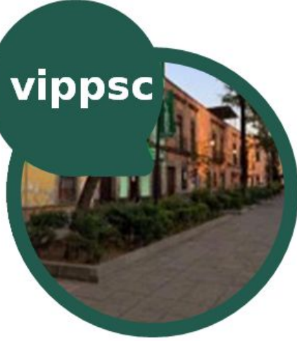
ANTIGUA MERCED MIXCALCO