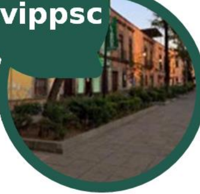
ANTIGUA MERCED MIXCALCO