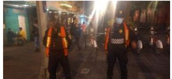
Recorridos de Seguridad San Jerónimo