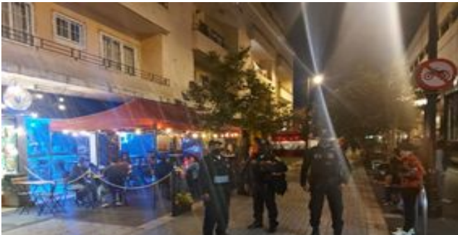
Recorridos de Seguridad Regina