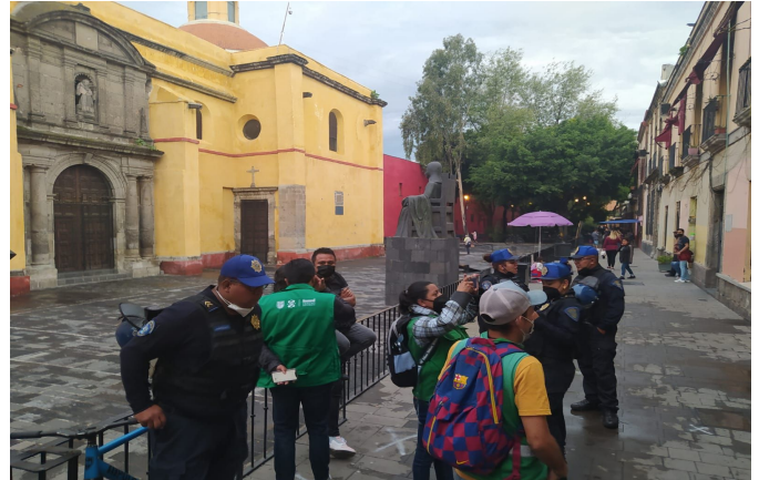
Supervisión San Jerónimo