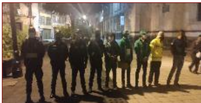
INVEA San Jeronimo-Regina