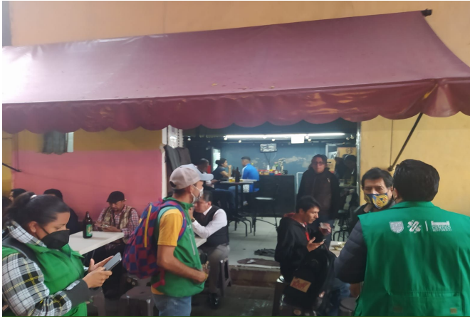
Supervisión San Jerónimo