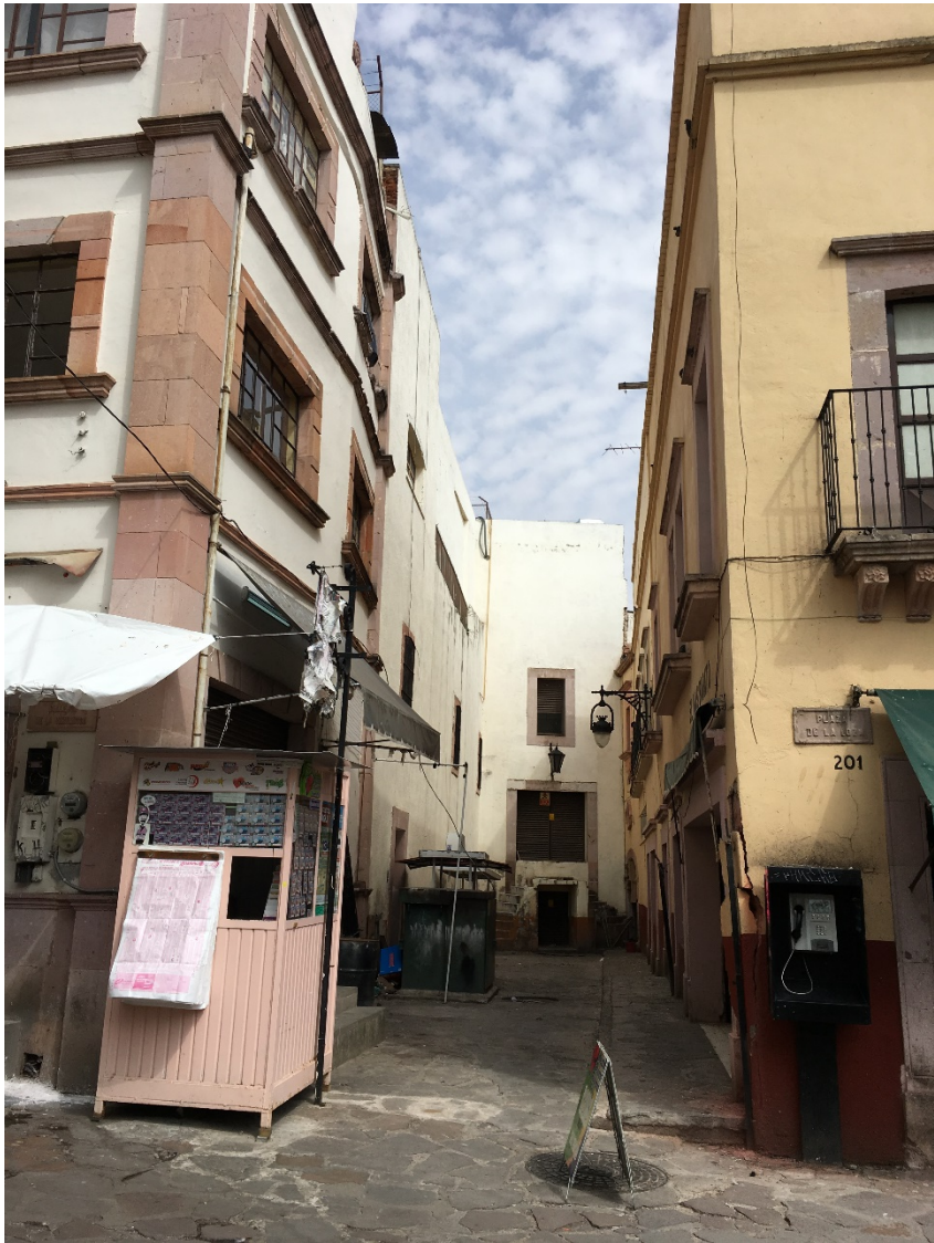
Imagen: Plazuela Genaro Codina.