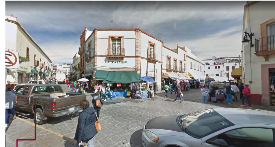
Estacionamiento en áreas prohibidas

Se mejoraran las características físicas